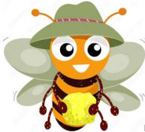
Grand jeu « la course au pollen »