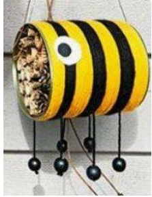
Fabrication d'un hôtel à insectes