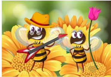
Le bal des abeilles