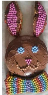
Atelier pâtisserie et décoration de Pâques