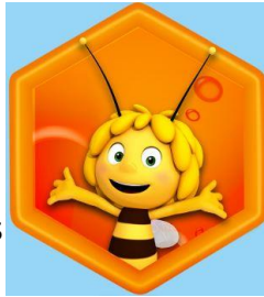
Grand jeu « à la recherche de Maya »