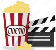
Séance cinéma « Maya l'abeille »